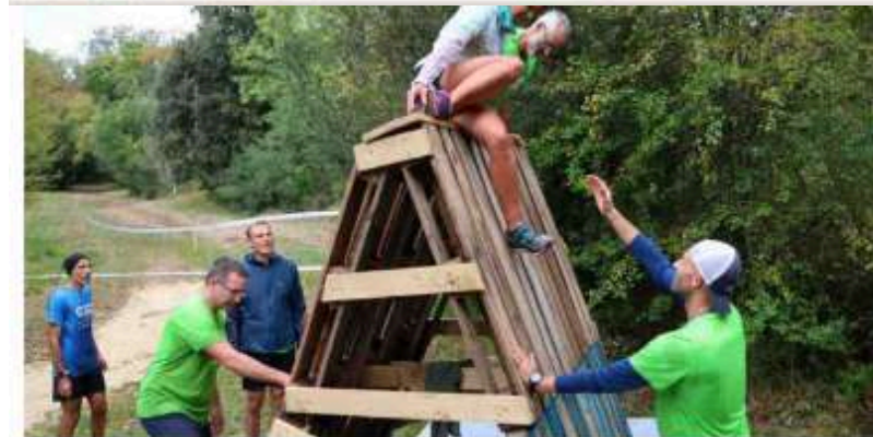
L'épreuve ludique de La Folle Roche sera au programme des Marches et courses nature à La Roche Courbon, s.l.

Sur le domaine de La Roche Courbon, à Saint-Porchaire, le week-end des 19 et 20 octobre est déjà à inscrire sur les tablettes, des plus jeunes aux vétérans. Au programme, l'envie de partager un esprit sport nature, entre les adeptes de la marche à la découverte du patrimoine local le samedi soir, les compétitifs le dimanche matin, sans oublier les aventuriers de La Folle Roche. Cette année, pour cette 11 e édition, les organisateurs ont prévu des nouveautés. Ainsi, toute la journée du 18 octobre, à la veille du grand week-end et pour une première fois, les élèves du collège Fontbrunant vont participer au Cross du collège, sur des distances adaptées selon les classes, de la sixième à la troisième.